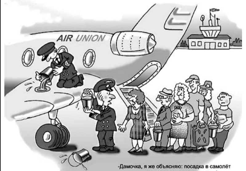
-Дамочка, я же объясняю: посадка в самолёт только со своим керосином!

Очевидно, что кто-то в стране в очередной раз попытался отыграться на гастарбайтерах. При этом интересно, что удар ниже пояса был нанесен именно по кормильцам республики, потому как, согласно официальной